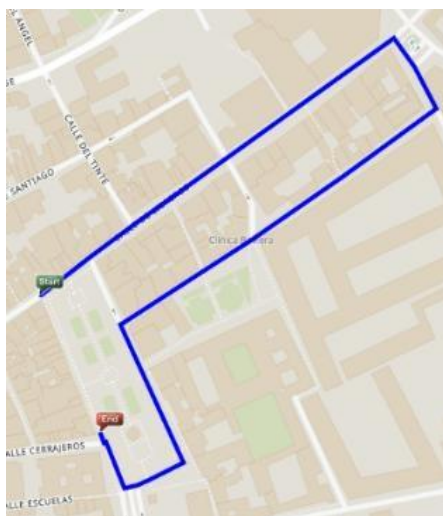
Imagen. Recorrido Carrera Sub 14