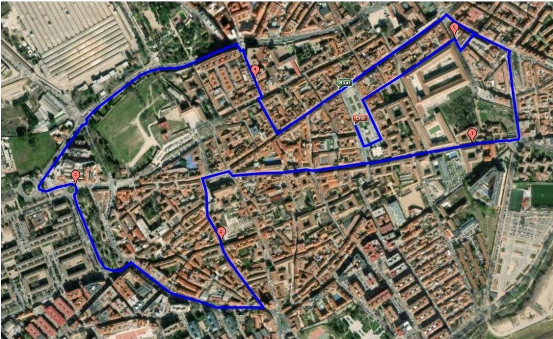
Imagen. Recorrido del Circuito “Legua Popular Quijote y Dulcinea 2025”

Calle Mayor, Plaza de Cervantes, Calle Libreros, Calle Teniente Ruiz, Paseo de Alameda, Calle Giner de los ríos, Fuente de Aguadores , Ca Colegios, Calle Escritorios, Plaza de Los Santos ,Calle Tercia, Calle Damas, Paseo de los Curas, Avda. Reyes Católicos, Calle Demetrio Ducar, Vía Complutense, Calle Diego de Torres, Calle Santiago, Calle de la Imagen, Calle Mayor, Plaza Cervantes, Calle Libreros, Calle Teniente Ruiz, Calle Cruz de Guadalajara, Calle Azucena, Calle San Diego, Plaza San Diego, Calle Bustamante de la Cámara y Plaza Cervantes.