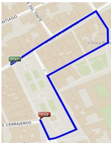
Imagen. Recorrido Carrera Sub10