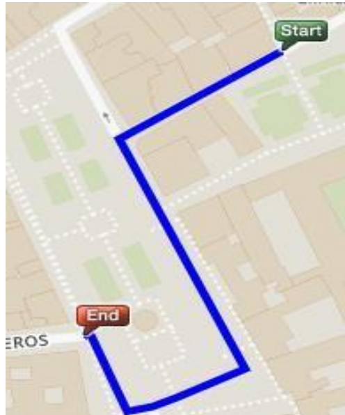
Imagen. Recorrido Carrera Sub8